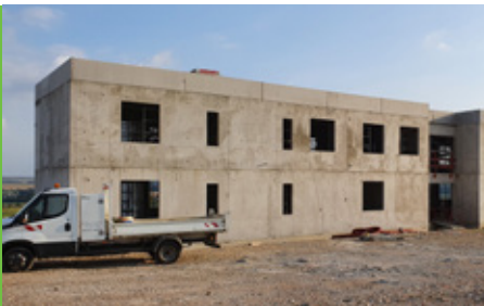
siège social Mercy - septembre 2021

Dans notre précédent numéro, nous vous annonçons le démarrage de 3 grands chantiers de construction : le nouveau siège social de l'association sur le site de Mercy, le FESAT de Faulquemont et la restructuration des ESAT De Brack/Le Village. Un an après, où en sommes-nous ?