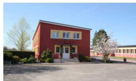
IME Le Wenheck