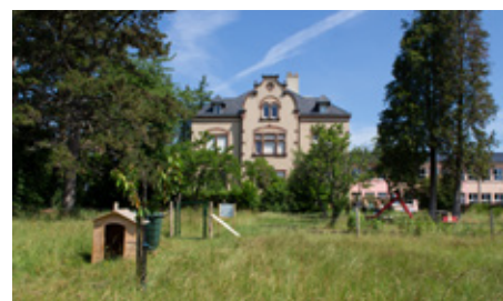
IME La Sapinière