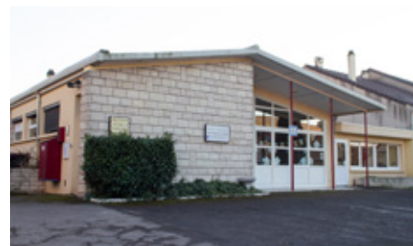
IME L'Horizon - Thionville

Les collèges René Cassin et Lionel Terray ainsi que l'école primaire du Stade sont pleinement par-ties prenantes de ces projets inclusifs. En mettant à disposition les salles de classe et les installations, le Conseil Départemental de Moselle et la mairie de Valmont participent également à cette aventure inclusive. Nous nous réjouissons de ces collaborations et de leurs aboutissements. Bravo aux équipes porteuses de ces projets et merci à tous nos partenaires.